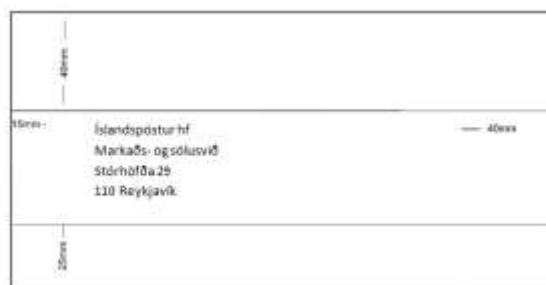
Mynd 2: Afmarkað svæði fyrir nafn og heimilisfang viðtakanda